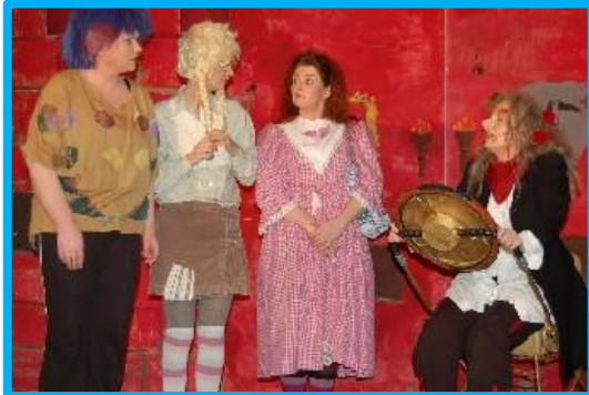
De Magische Droom uit 2006

Op donderdag 15 december gaan de groepen 3 t/m 7 naar het 'Sprookje' van VOO in De Postwagen in Tolbert. De leerlingen van de groepen 3A, 3B, 4A en 4B gaan met de bus; de leerlingen van de groepen 5, 6 en 7 gaan lopend. In de tijd dat de groepen 3 t/m 7 bij het 'Sprookje' in Tolbert zijn, voert onze 'eigen' toneelgroep hier op school het sprookje "De Magische Droom" op voor de groepen 1 en 2. Behalve onze kleuters, kijken er op donderdag en vrijdag ook kinderen van nog 7 andere scholen naar ons sprookje. Er worden 's morgens twee voorstellingen gegeven en 's middags nog een.