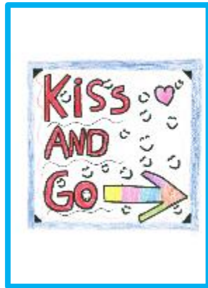
Ontwerp van Niene